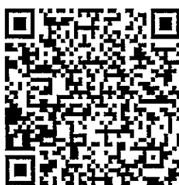
Master's Studies 2